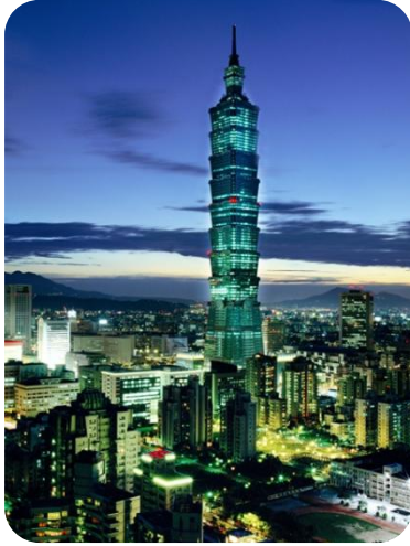
Taipei 101, the World’s tallest building

A primary school in suburban Taipei, YiXian (Sun Yat-sen) Elementary School with its 866 students and 66 teachers, has already been designated as the “host” school for the Belgian team. With students’ parents, this will form a formidable “task force” to receive the Belgian delegation. The hosts will provide assistance wherever and whenever possible, ranging from transportation arrangement, tour guidance, to cheerleading for the Belgians at the Games, and so on. Altogether 85 schools in Taipei have been mobilized to help delegations from all over the world in the same way.