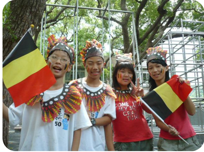
The students of the YiXian Elementary School make preparations for receiving the Belgian delegation

Several surrounding events will also take place, including the International Deaf Culture Fair which will present Taiwanese and international deaf talents and achievements. The Fair, along with the 2009 Deaflympics Social Centre, will be organized and run by the National Association for the Deaf in Taiwan. Athletes, guests, spectators, sponsors and all other participants will enjoy an assortment of entertainment, art work exhibition, and performances over the course of the event.